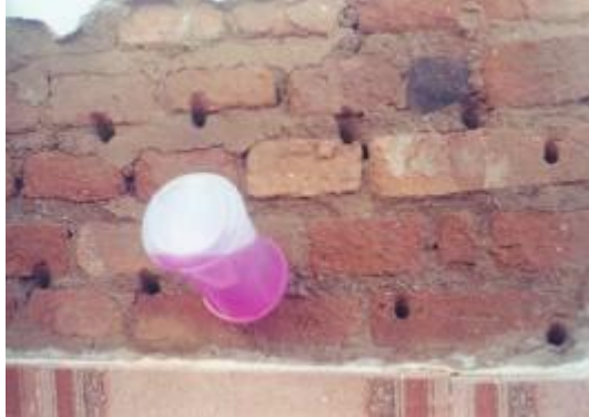
Figura 3: Aplicação De Cristalizantes Líquidos