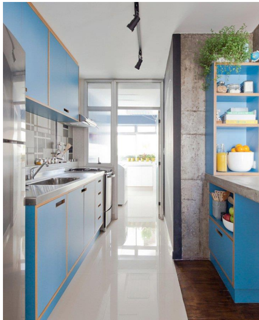
Figura 7: Resina Epóxi Aplicada em Piso