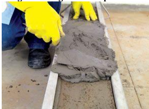
Figura 4: Argamassa impermeável

São argamassas compostas por cimento e areia com aditivos hidrofugantes, líquidos ou em pó, que reduzem a sua permeabilidade, criando repelência a água (Figura 4). Esses aditivos atuam de modo direto nos poros de argamassas e concreto, formando assim uma película absorvente à água, e ajudando a vedar o poro. Porém para reduzir a porosidade, é preciso que se reduza a relação água-cimento do concreto ou argamassa. (VEDACIT, 2016).