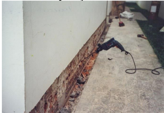
Figura 2: Furos Para Aplicação De Cristalizantes Líquidos

Outra categoria são os cristalizantes líquidos que contém silicatos e resinas em sua composição, se aplicados, cristalizam e ocupam os poros das alvenarias de tijolos maciços, impedindo a umidade provável. A tecnologia desses produtos evoluiu de tal forma que hoje, há silicatos ativos que no caso de novas fissuras, colmatam até 4mm de dimensão, Geralmente a sua aplicação se dá pela seguinte forma: Com o auxílio de uma furadeira, fazer furos em 45° com distância de 5 cm a 10 cm, um ao lado do outro desde o rodapé até a altura indicada conforme se apresenta a patologia em cada caso (Figura 2). Fazer uma carreira de furos intercalados acima da primeira fileira com distância de 5 a 10 cm. Cada furo deverá ser saturado com água, e com a ajuda de um funil ou seringa aplicar o cristalizante em cada furo. Aguardar 24 horas, refazer os furos com a furadeira, colocar novamente água em cada furo e reaplicar o cristalizante (Figura 3) (SILVA, 2018, online).