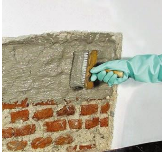
Figura 1: aplicação de cimentos cristalizantes