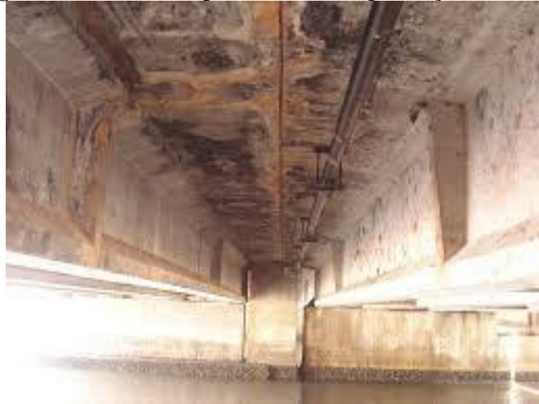
Figura 9: Deficiências que decorrem da presença de umidade

exemplo, manchas, bolores, ferrugem, apodrecimento, eflorescência, criptoflorescência, deterioração e gelividade (VERÇOZA, 1987), sem contar os gastos que são muito mais ostensivos no caso de se implantar sistemas de impermeabilização após ter sido danificado, que na construção da obra (HOUSSEN, 2013).