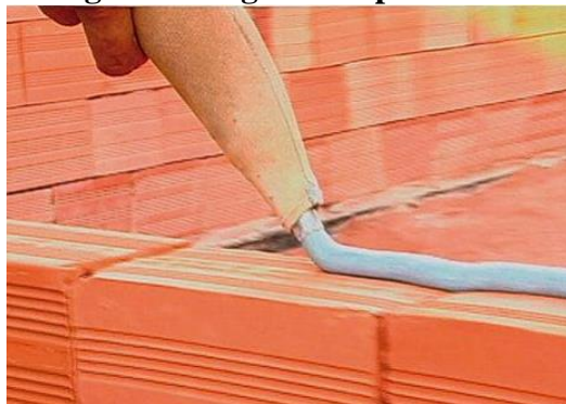
Figura 5: Argamassa polimérica

A NBR 11905 de 10/2015, especifica os requisitos mínimos exigíveis para argamassas poliméricas industrializadas (Figura 5) para impermeabilização sobre sistemas construtivos não sujeitos às fissuras dinâmicas, submetidas à atuação da água de lixiviação, mediante pressão negativa positiva. A argamassa polimérica, objeto que trata a Norma, é estanque à água, contudo, mas não possui vedação ao vapor dela.