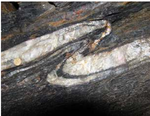
Figura 3 - Veio de quartzo e quartzo mineralizado