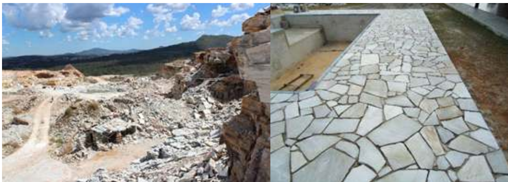
Figura 4 - Pedreira e revestimento produzido a partir dos quartzitos da Serra dos Pirineus.

Além do ouro, os quartzitos micáceos se tornaram uma importante matéria-prima para a produção de revestimentos para a construção civil em Pirinópolis. A exploração da Pedra de Pirinópolis, nome comercial dado aos quartzitos micáceos, se tornou uma importante atividade para a economia local.