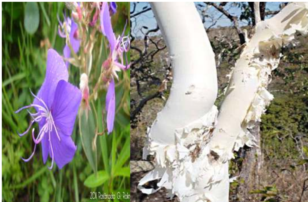
Figura 5 - Espécie de Tibouchina papyrus - pau-papel- árvore símbolo do Cerrado.

Em nível de fitofisionomia de Cerrado e composição de flora nativa destacam-se as formações savânicas- cerrado stricto sensu e campestres- Campos rupestre. Em estudos de Moura et al. (2010) sobre a composição florística foi contabilizado um total de 35 famílias, 51 gêneros e 65 espécies distribuídos em Myrtaceae, Fabaceae, Melastomataceae, Vochysiaceae e Orchidaceae. espécies características deste cerrado de Pirenópolis, como Alchornea triplinervia (Spreng) Müll. Arg., Tibouchina papyrus (Pohl) Toledo (pau-papel do Cerrado), Schwartzia adamantium (Cambess.) Bedell ex Gir.- Cañas (mel de arara) e Clusia burchelli Burchell (figueira, Clusia ) e de outro por espécies generalistas do Cerrado como Qualea parviflora , Qualea grandiflora , Byrsonima verbascifolia , Byrsonima crassa , Vochysia rufa , Ouratea hexasperma e Pouteria ramiflor , a saber: