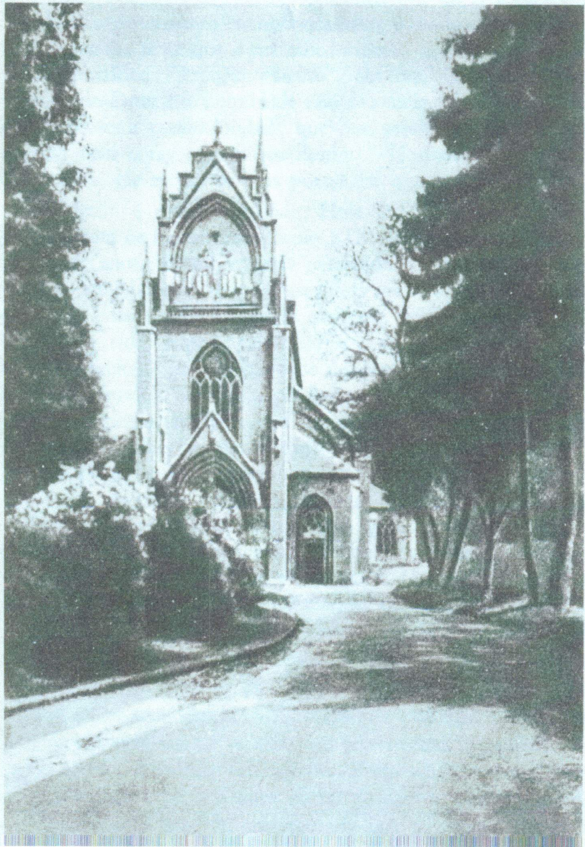
Escola de Pforta.