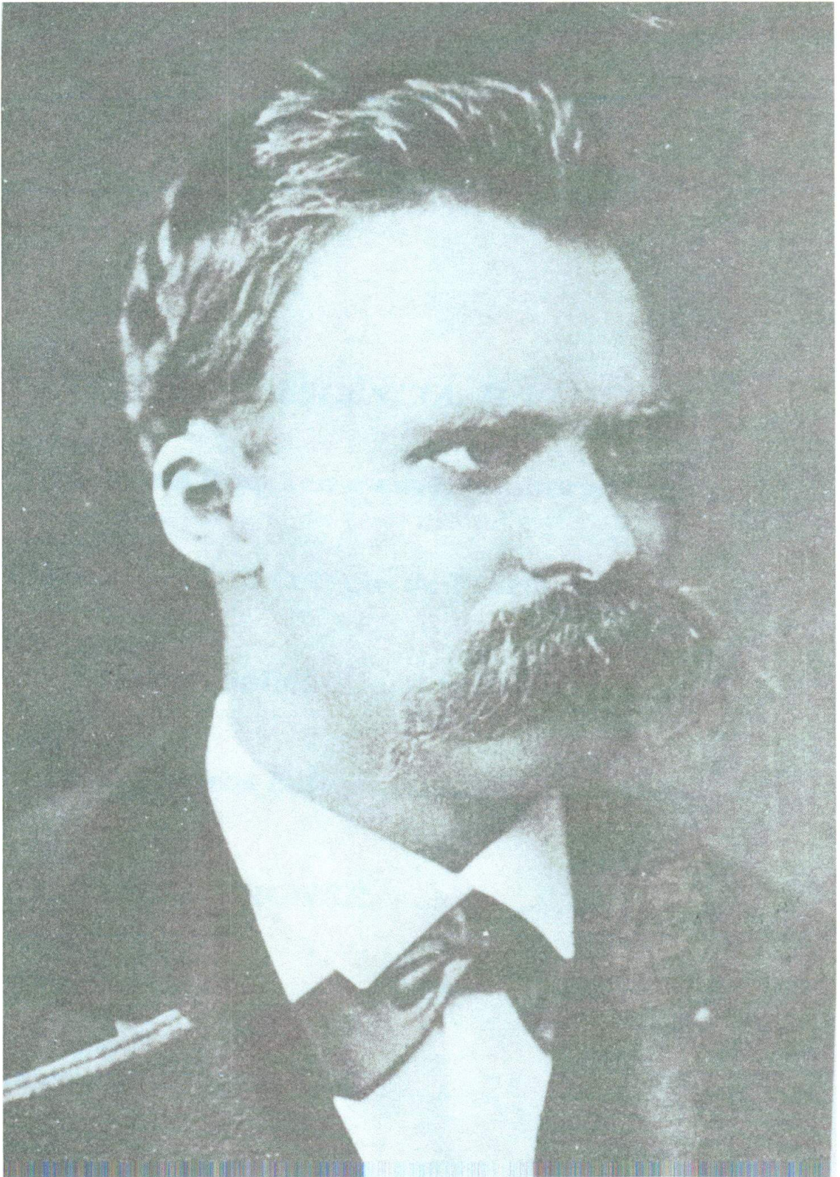
Nietzsche em 1873.