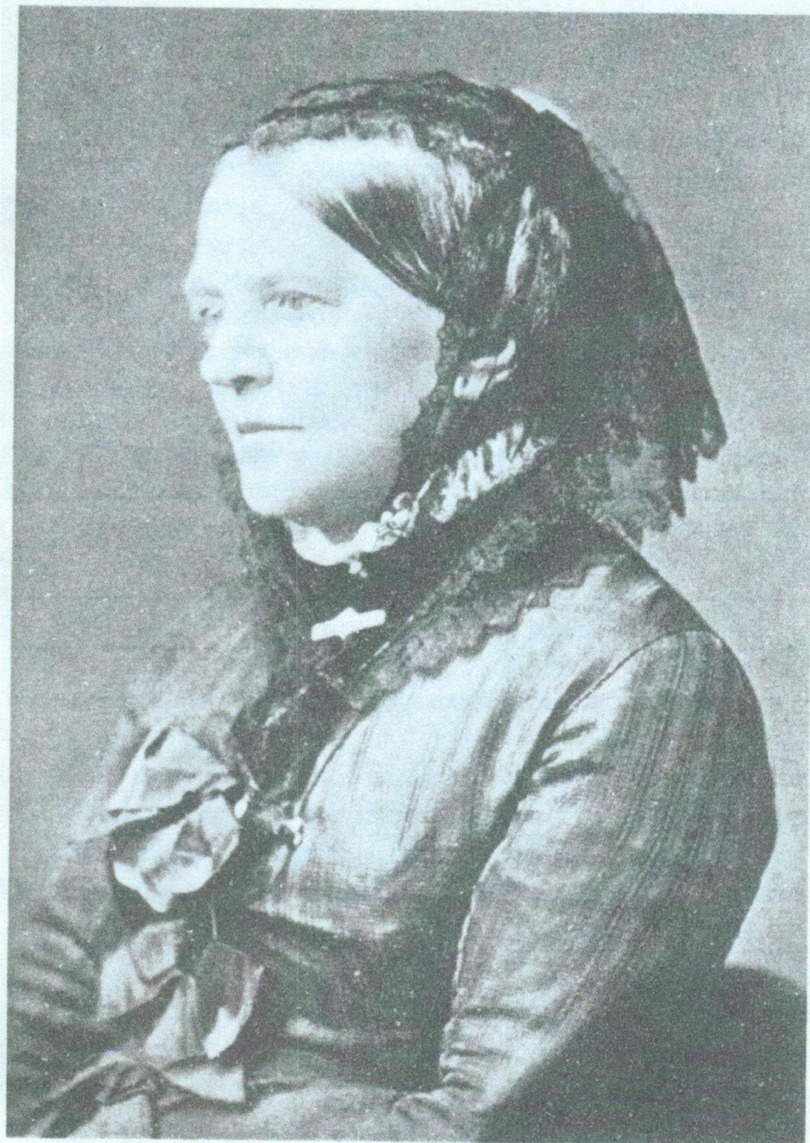
Malwida von Meysebug