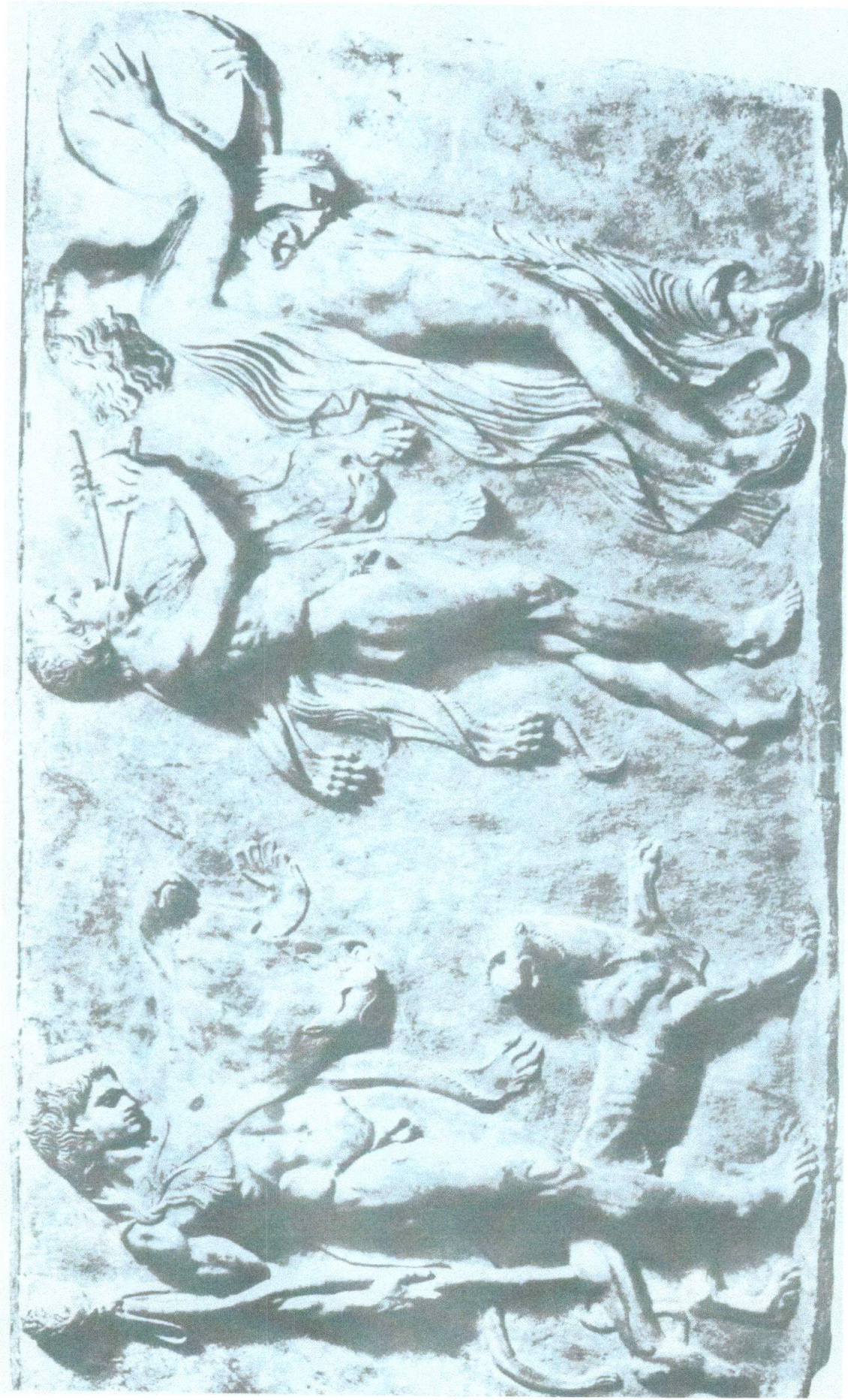
Dionísio, Pã e uma Bacante. Baixo-Relevo antigo. Museu Nacional, Nápoles.