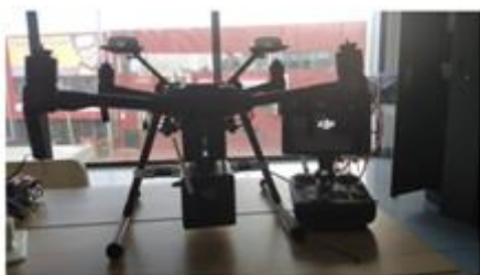
Figura 3: VANT de 4 motores, com uma dimensão de (716X220X236) mm e aproximadamente 3.8 kg.

No trabalho de Silva (2021) na obtenção de Imagens Aéreas Multiespectrais para Agricultura utilizou de um VANT de 4 motores, com uma dimensão de (716X220X236) mm e aproximadamente 3.8 kg equipado com um câmara multiespectral Rededge-M da MicaSense para recolher imagens aéreas para realizar classificação de espécies na vegetação, a qual obteve como amostra 2500 imagens aéreas de 4 espécies diferentes, conforme representado na figura 3 abaixo: