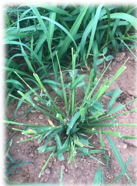
FIGURA 1 – Corte do capim-mombaça ( Panicum maximum ) para uniformização aos 60 dias após a sementeira, Abadiânia, Goiás

A partir da emergência das folhas, aos dez dias após a sementeira, foram realizadas medidas de altura do dossel forrageiro para acompanhar o desenvolvimento das plantas, com o auxílio de uma régua graduada em cm, antes e depois de cada corte efetuado, uma vez por semana. Aos 75 dias após a sementeira (DAS), com ajuda de tesouras, foi realizado o primeiro corte de uniformização com a altura de resíduo de dez cm do solo, na intenção de padronizar o tamanho do capim em todas as unidades experimentais, para assim averiguar a influência das doses do bioestimulante no próximo corte avaliativo, como apresentado na Figura 1. O segundo corte foi feito 15 dias após o primeiro.